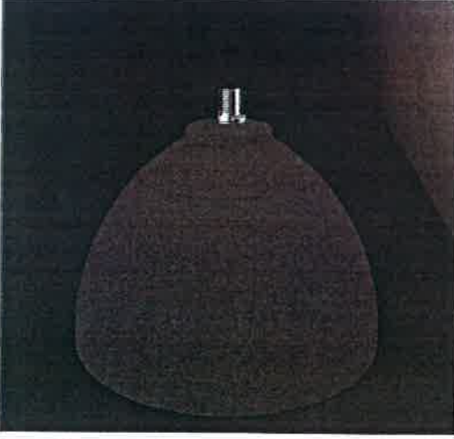
Ilustrační foto svítidla požadovaná barva svítidla: černá (BK1)